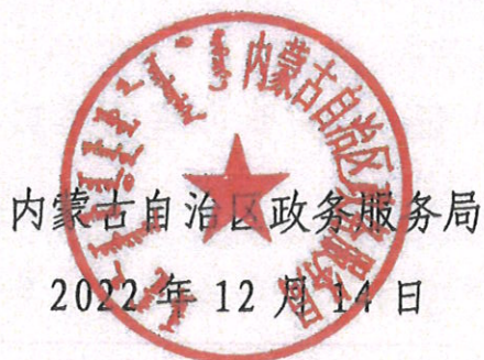
内蒙古自治区政务服务局