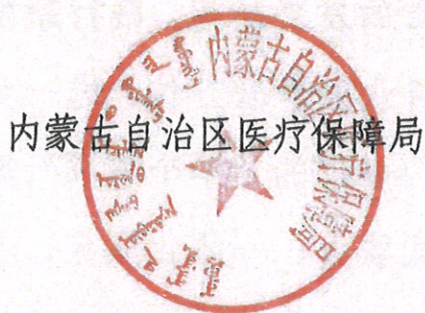
内蒙古自治区医疗保障局