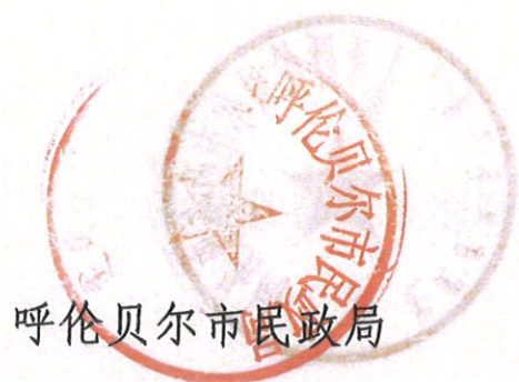
呼伦贝尔市民政局

附件：内蒙古自治区民政厅 公安厅、人力资源和社会保障厅、住房和城乡建设厅、卫生健康委员会、退役军人事务厅、医疗保障局、政务服务局、大数据中心《关于印发〈内蒙古自治区公民身后“一件事一次办”工作实施方案〉的通知》（内民政发〔2022〕118号）