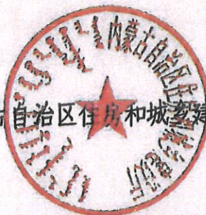
内蒙古自治区住房和城乡建设厅