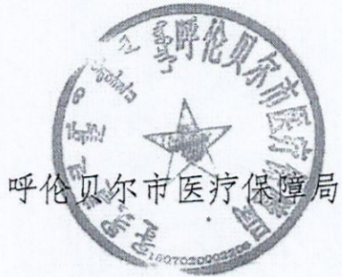
呼伦贝尔市医疗保障局