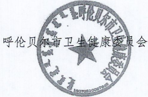
呼伦贝尔市卫生健康委员会