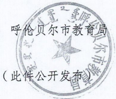
呼伦贝尔市教育局