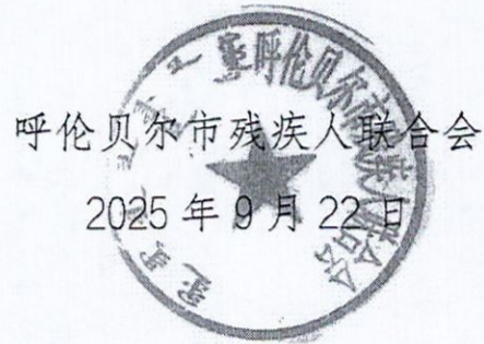
呼伦贝尔市残疾人联合会