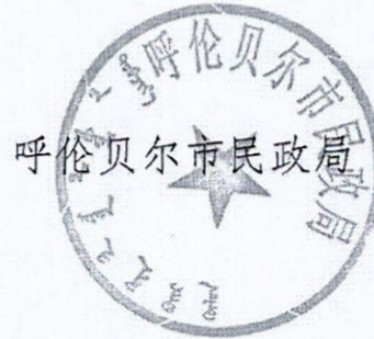
呼伦贝尔市民政局