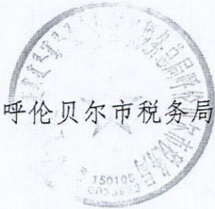
呼伦贝尔市税务局