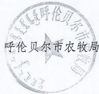
呼伦贝尔市农牧局