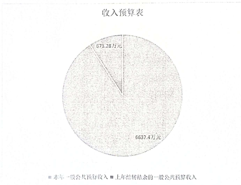
图 1. 收入预算图

本年上级补助收入 0 万元，占 0 %； 本年附属单位上缴收入 0 万元，占 0 %； 本年其他收入 0 万元，占 0 %； 上年结转结余的一般公共预算收入 673.28 万元，占 9.21 %； 上年结转结余的政府性基金预算收入 0 万元，占 0 %； 上年结转结余的国有资本经营预算收入 0 万元，占 0 %； 上年结转结余的财政专户管理资金 0 万元，占 0 %； 上年结转结余的单位资金 0 万元，占 0 %。