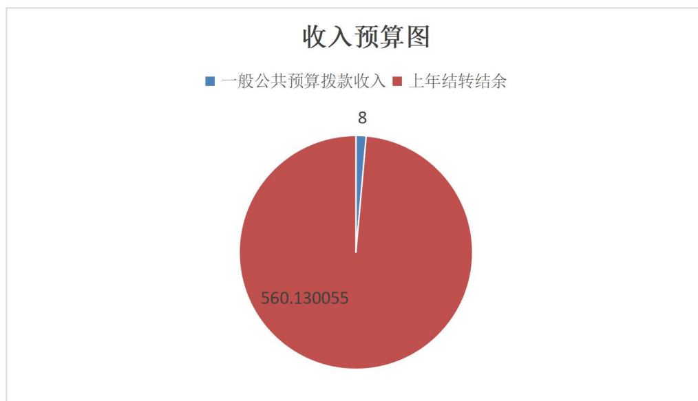
图 1. 收入预算图